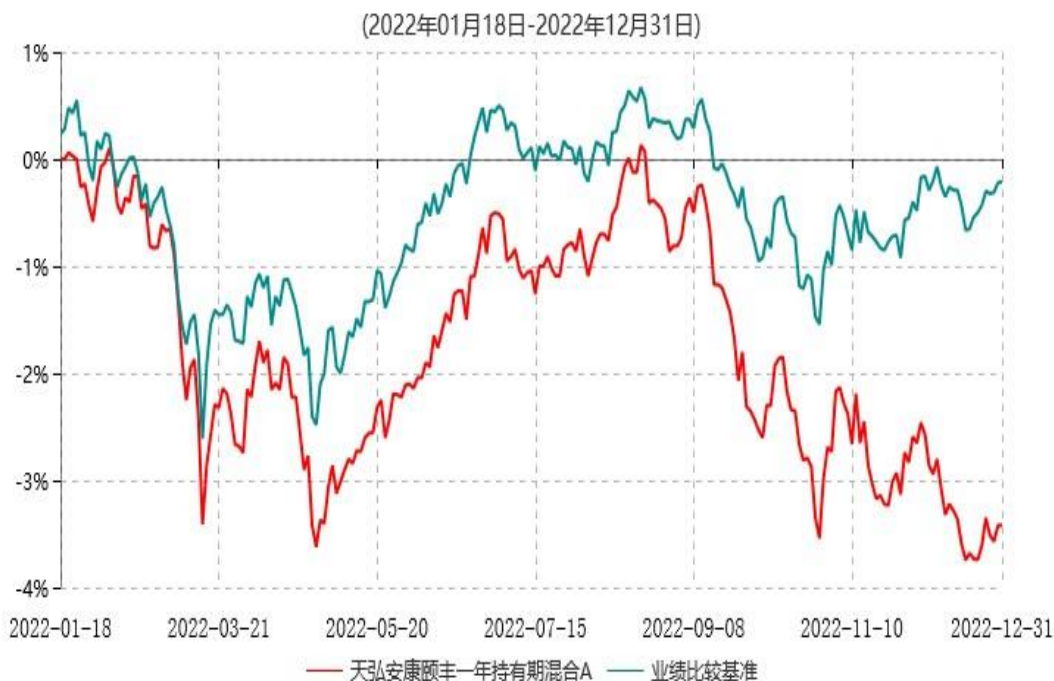
天弘安康颐丰一年持有期混合A累计净值增长率与业绩比较基准收益率历史走势对比图