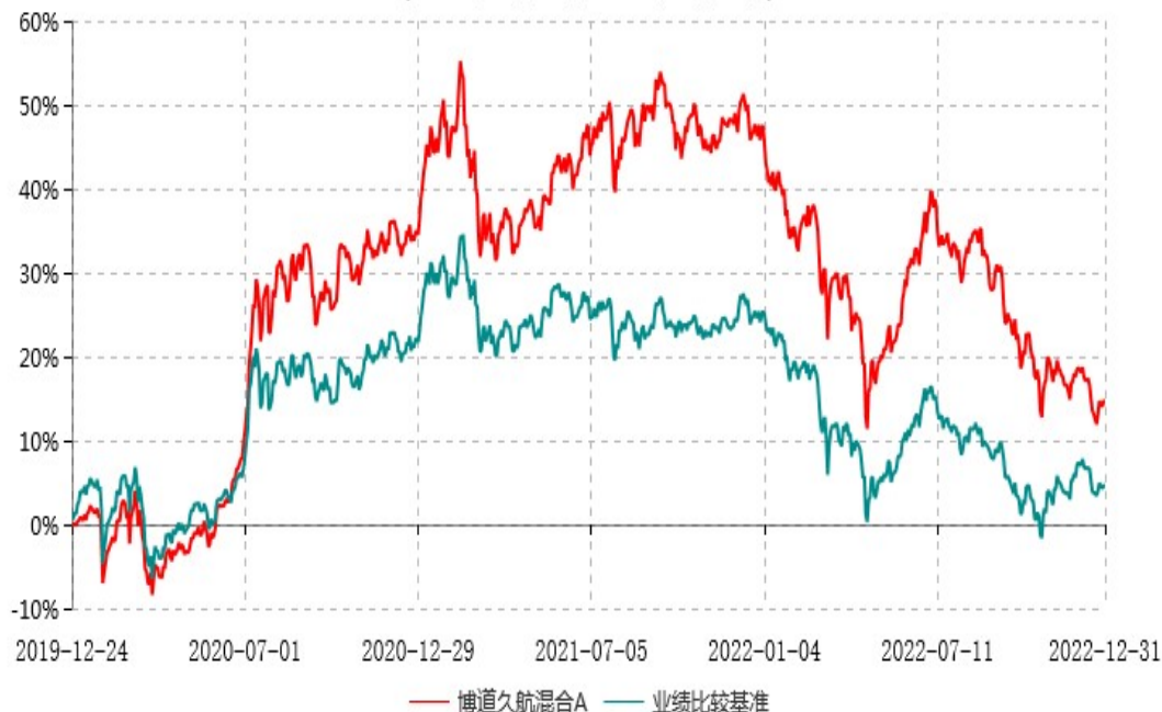
博道久航混合A累计净值增长率与业绩比较基准收益率历史走势对比图 (2019年12月24日-2022年12月31日)

注：本基金建仓期为自基金合同生效日起的6个月。截至建仓期结束，本基金各项资产配置比例符合基金合同及招募说明书有关投资比例的约定。