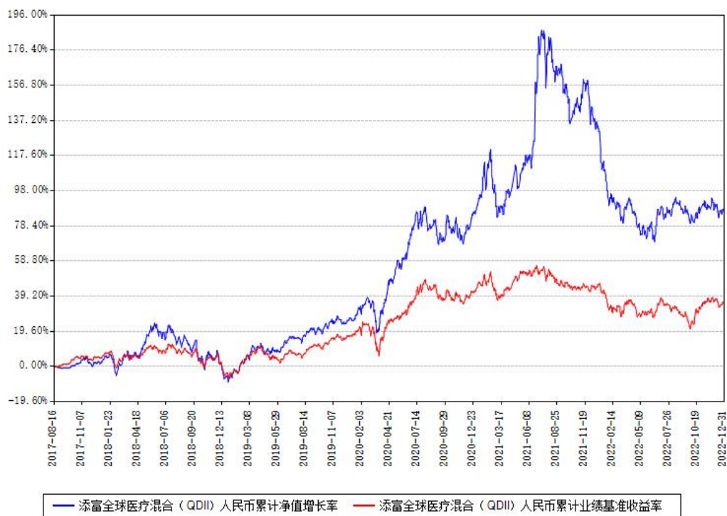
添富全球医疗混合（QDII）人民币累计净值增长率与同期业绩基准收益率对比图