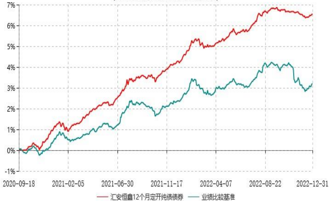
汇安恒鑫12个月定期开放纯债债券型发起式证券投资基金累计净值增长率与业绩比较基准收益率历史走势对比图 (2020年09月18日-2022年12月31日)