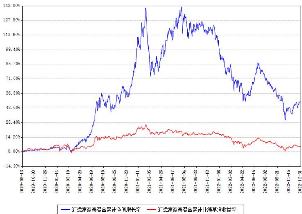
汇添富盈泰混合累计净值增长率与同期业绩基准收益率对比图

注：本基金建仓期为本《基金合同》生效之日（2019年08月13日）起6个月，建仓期结束时各项资产配置比例符合合同约定。