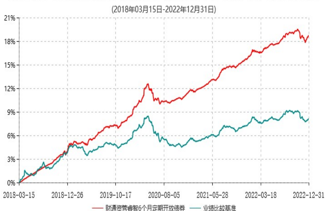
财通资管睿智6个月定期开放债券型发起式证券投资基金累计净值增长率与业绩比较基准收益率历史走势对比图