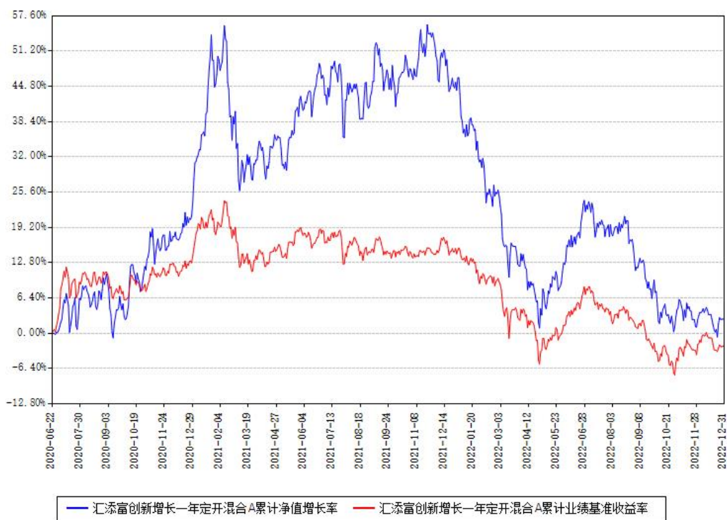
汇添富创新增长一年定开混合A累计净值增长率与同期业绩基准收益率对比图