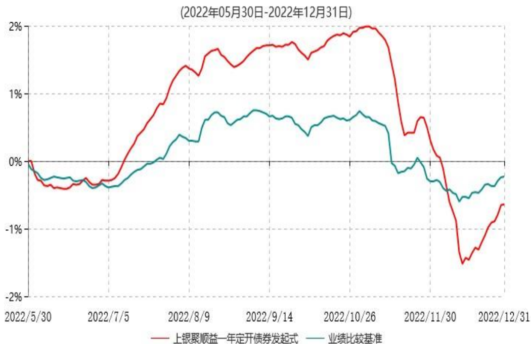
上银聚顺益一年定期开放债券型发起式证券投资基金累计净值增长率与业绩比较基准收益率历史走势对比图

注：本基金合同生效日为2022年5月30日，自基金合同生效日起6个月内为建仓期，建仓期结束时各项资产配置比例符合基金合同约定；截至本报告期末，基金合同生效不满一年。