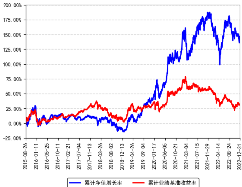
南方国策动力股票累计净值增长率与同期业绩比较基准收益率的历史走势对比图