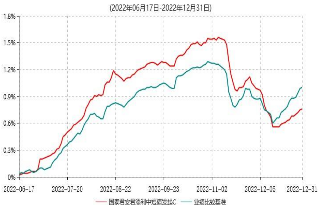
国泰君安君添利中短债发起C累计净值增长率与业绩比较基准收益率历史走势对比图

注：1、本基金于2022年6月17日成立，自合同生效日起至本报告期末不足一年。 2、按基金合同和招募说明书的约定，本基金的建仓期为六个月，建仓期结束时各项资产配置比例符合基金合同的有关约定。