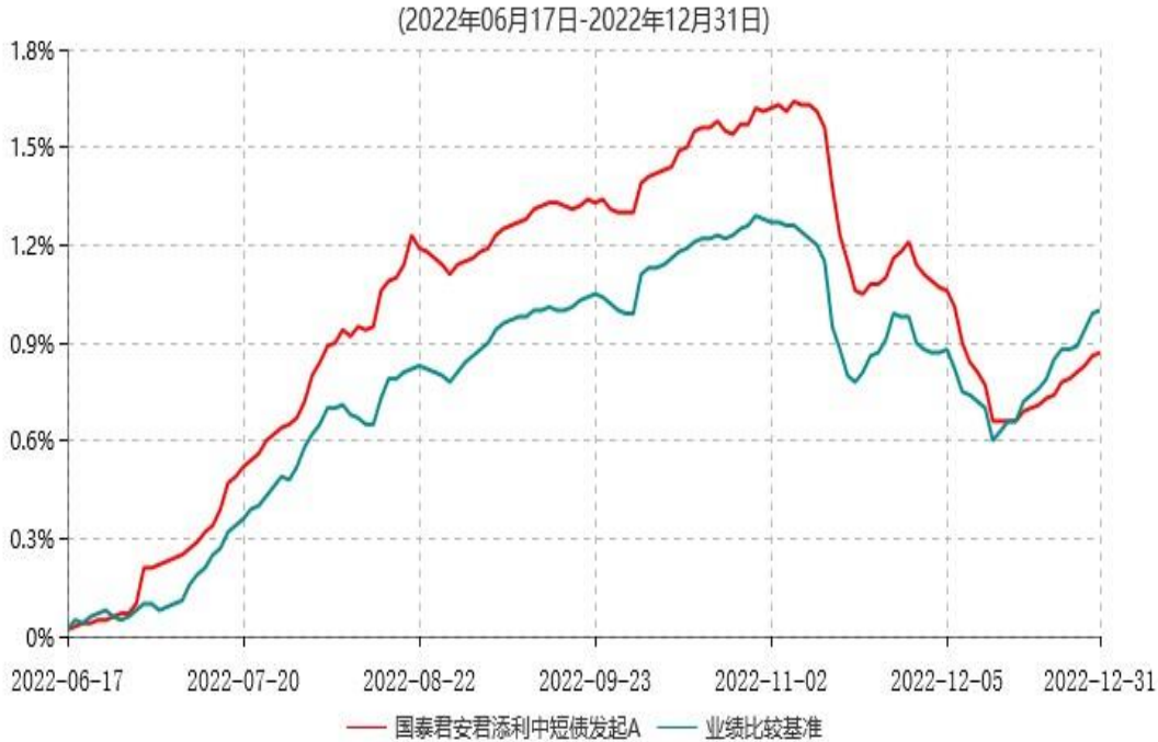
国泰君安君添利中短债发起A累计净值增长率与业绩比较基准收益率历史走势对比图