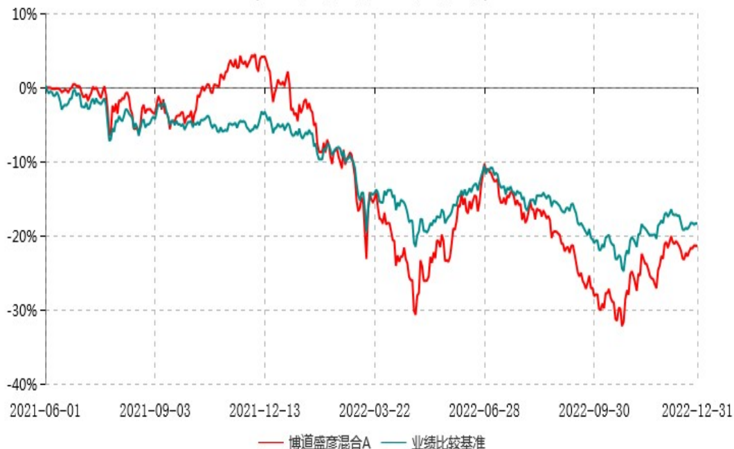
博道盛彦混合A累计净值增长率与业绩比较基准收益率历史走势对比图 (2021年06月01日-2022年12月31日)

注：本基金建仓期为自基金合同生效日起的6个月。截至建仓期结束，本基金各项资产配置比例符合基金合同及招募说明书有关投资比例的约定。