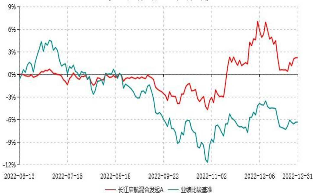
长江启航混合发起A累计净值增长率与业绩比较基准收益率历史走势对比图 (2022年06月13日-2022年12月31日)