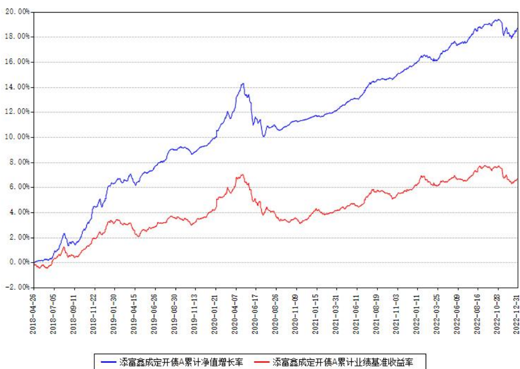
添富鑫成定开债A累计净值增长率与同期业绩基准收益率对比图

注：本基金建仓期为本《基金合同》生效之日（2018年04月26日）起6个月，建仓期结束时各项资产配置比例符合合同约定。