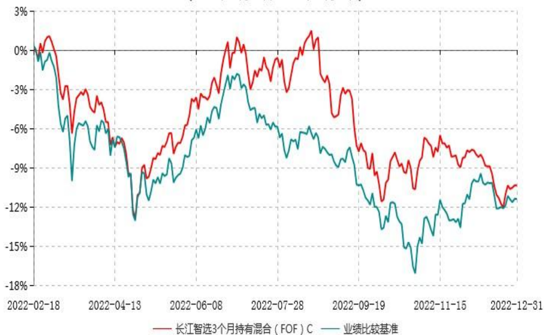
长江智选3个月持有混合（FOF）C累计净值增长率与业绩比较基准收益率历史走势对比图 (2022年02月18日-2022年12月31日)

注：（1）本基金A类份额“自基金合同生效以来”的报告期为2022年1月28日至2022年12月31日，截至本报告期末未满一年；（2）本基金建仓期为基金合同生效日起6个月内，建仓期结束时各项资产配置比例均符合基金合同约定。