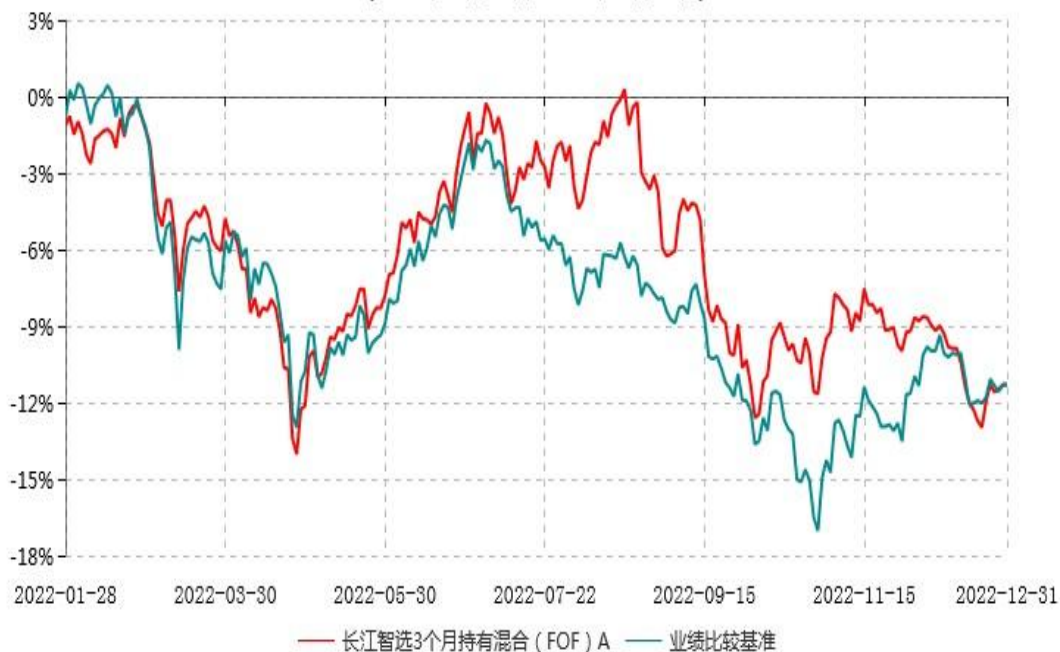
长江智选3个月持有混合（FOF）A累计净值增长率与业绩比较基准收益率历史走势对比图 (2022年01月28日-2022年12月31日)

注：（1）本基金A类份额“自基金合同生效以来”的报告期为2022年1月28日至2022年12月31日，截至本报告期末未满一年；（2）本基金建仓期为基金合同生效日起6个月内，建仓期结束时各项资产配置比例均符合基金合同约定。