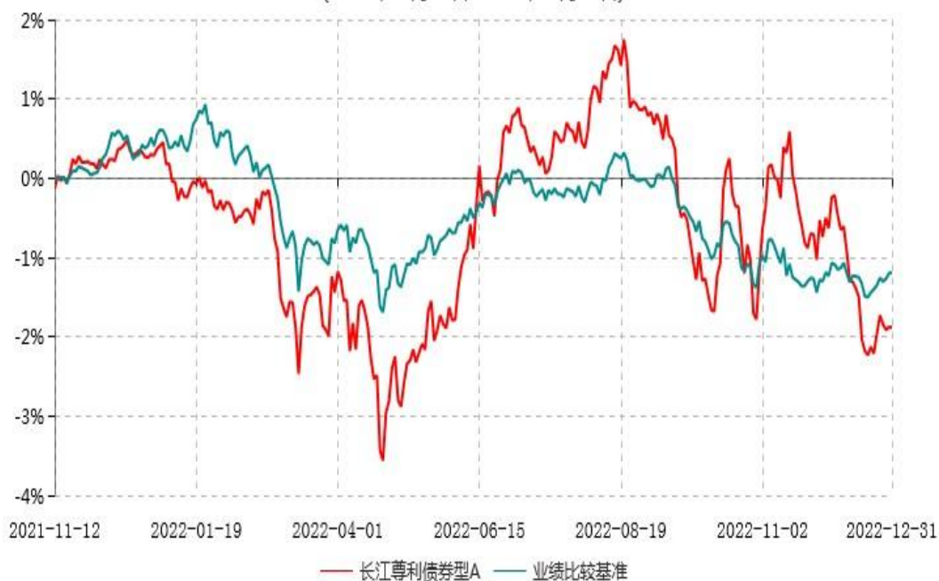
长江尊利债券型A累计净值增长率与业绩比较基准收益率历史走势对比图 (2021年11月12日-2022年12月31日)

注：本基金A类份额“自基金合同生效以来”的报告期为2021年11月12日至2022年12月31日，建仓期为基金合同生效日起6个月内，建仓期结束时各项资产配置比例均符合基金合同约定。