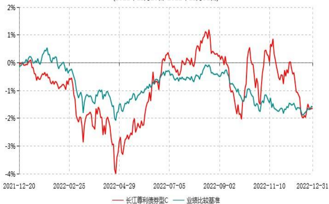
长江尊利债券型C累计净值增长率与业绩比较基准收益率历史走势对比图 (2021年12月20日-2022年12月31日)

注：本基金A类份额“自基金合同生效以来”的报告期为2021年11月12日至2022年12月31日，建仓期为基金合同生效日起6个月内，建仓期结束时各项资产配置比例均符合基金合同约定。