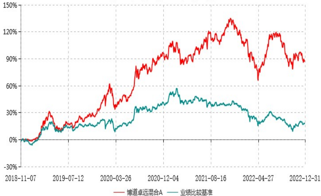
博道卓远混合A累计净值增长率与业绩比较基准收益率历史走势对比图 (2018年11月07日-2022年12月31日)

注：本基金建仓期为自基金合同生效日起的6个月。截至建仓期结束，本基金各项资产配置比例符合基金合同及招募说明书有关投资比例的约定。