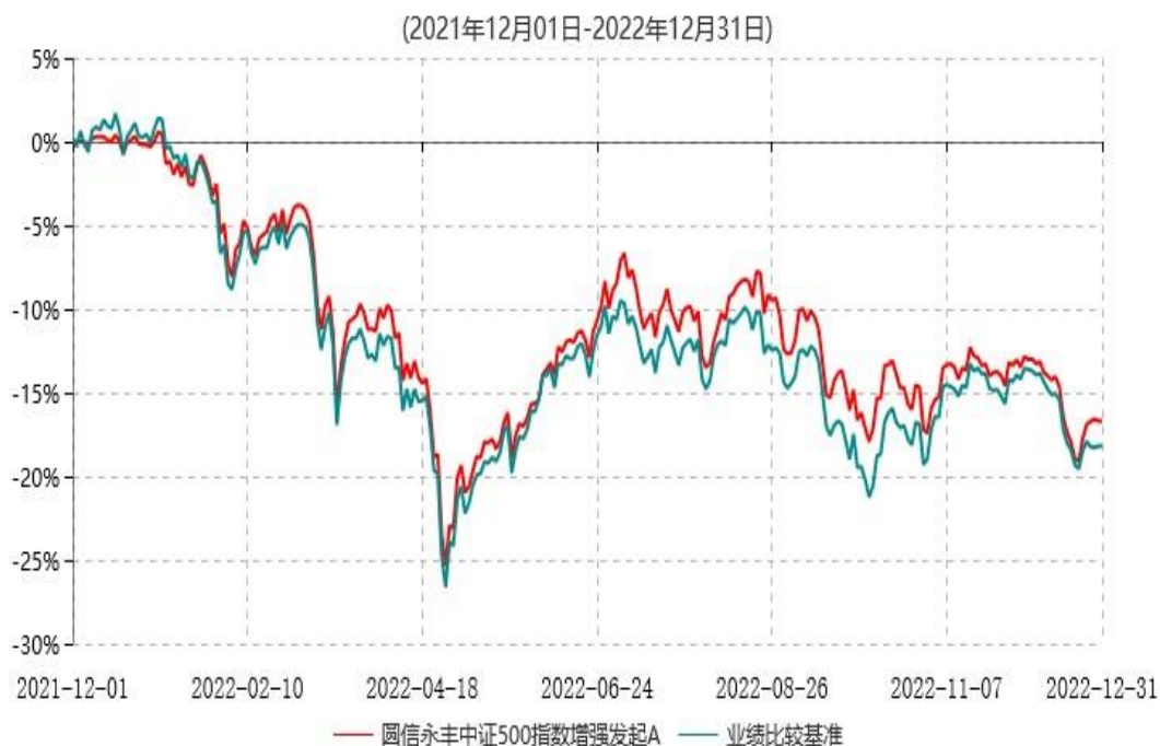
圆信永丰中证500指数增强发起A累计净值增长率与业绩比较基准收益率历史走势对比图

注：自基金合同生效后，截止报告期末，本基金成立满一年；本基金已完成建仓但报告期末距建仓结束不满一年，建仓结束时各项资产配置比例符合合同约定。