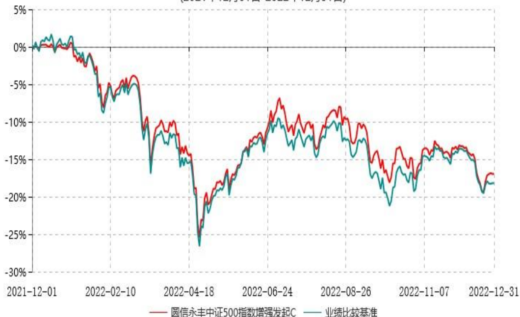
圆信永丰中证500指数增强发起C累计净值增长率与业绩比较基准收益率历史走势对比图 (2021年12月01日-2022年12月31日)

注：自基金合同生效后，截止报告期末，本基金成立满一年；本基金已完成建仓但报告期末距建仓结束不满一年，建仓结束时各项资产配置比例符合合同约定。