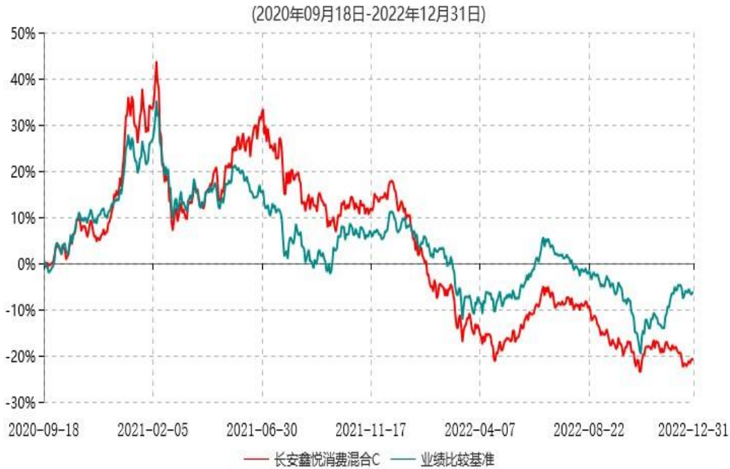
长安鑫悦消费混合C累计净值增长率与业绩比较基准收益率历史走势对比图

根据基金合同的规定,自基金合同生效之日起6个月内基金各项资产配置比例需符合基金合同要求。本基金在建仓期结束后,各项资产配置比例已符合基金合同有关投资比例的约定。本基金于2020年9月18日成立,基金合同生效日至报告期末,本基金运作时间已满一年。图示日期为2020年9月18日至2022年12月31日止。