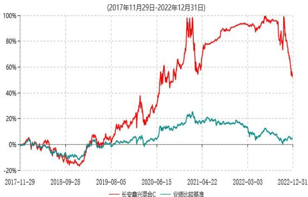
长安鑫兴混合C累计净值增长率与业绩比较基准收益率历史走势对比图

根据基金合同的规定,自基金合同生效之日起6个月内基金各项资产配置比例需符合基金合同要求。截止到建仓期结束时,本基金的各项投资组合比例已符合基金合同的相关规定。基金合同生效日至报告期期末,本基金运作时间已满一年。图示日期为2017年11月29日至2022年12月31日。