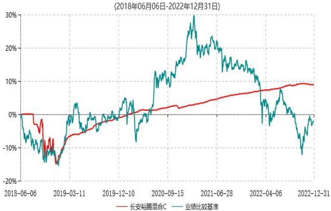
长安裕腾混合C累计净值增长率与业绩比较基准收益率历史走势对比图

根据基金合同的规定,自基金合同生效之日起6个月内基金各项资产配置比例需符合基金合同要求。本基金在建仓期结束后,各项资产配置比例已符合基金合同有关投资比例的约定。基金合同生效日至报告期末,本基金运作时间已满一年。图示日期为2018年06月06日至2022年12月31日。