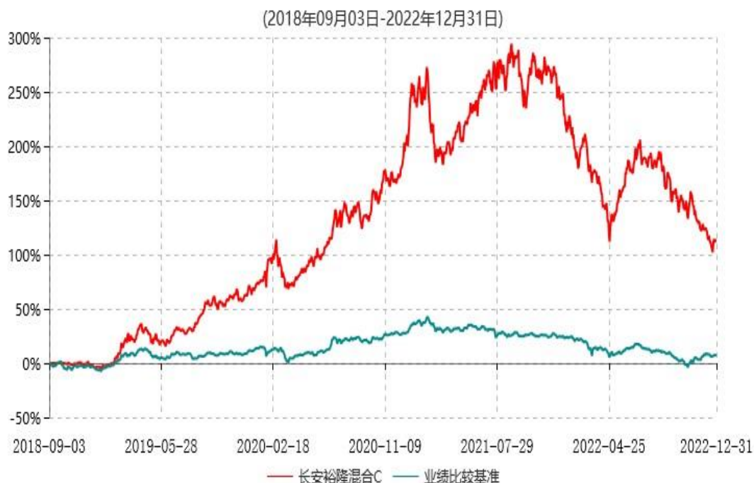
长安裕隆混合C累计净值增长率与业绩比较基准收益率历史走势对比图

根据基金合同的规定,自基金合同生效之日起6个月内基金各项资产配置比例需符合基金合同要求。本基金在建仓期结束后,各项资产配置比例已符合基金合同有关投资比例的约定。基金合同生效日至报告期末,本基金运作时间已满一年。图示日期为2018年09月03日至2022年12月31日。