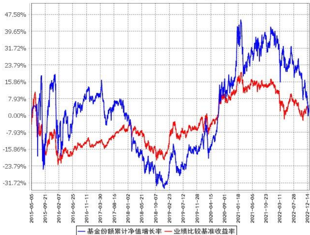
基金份额累计净值增长率与同期业绩比较基准收益率的历史走势对比图 (2015年5月5日至2022年12月31日)