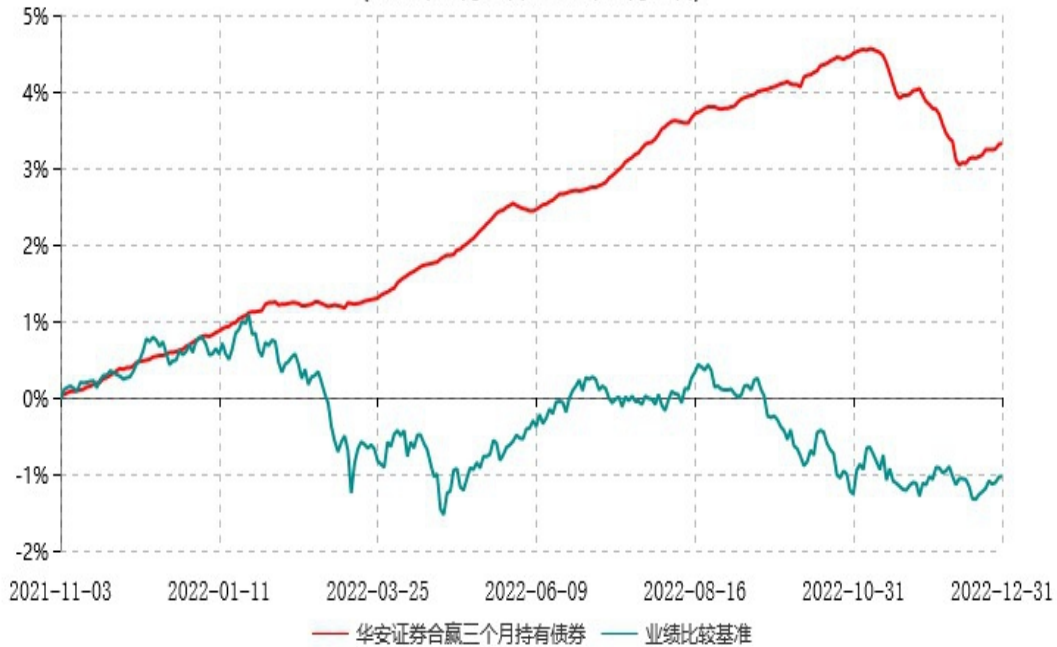
华安证券合赢三个月持有期债券型集合资产管理计划累计净值增长率与业绩比较基准收益率历史走势对比图 (2021年11月03日-2022年12月31日)