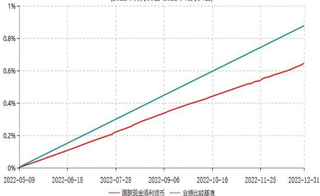
国联现金添利货币型集合资产管理计划累计净值收益率与业绩比较基准收益率历史走势对比图 (2022年05月09日-2022年12月31日)

注：1.本集合计划合同生效日为 2022年5月9日（由证券公司大集合资产管理产品变更而来），自合同生效日起至本报告期末不满一年。