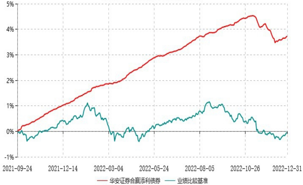
华安证券合赢添利债券型集合资产管理计划累计净值增长率与业绩比较基准收益率历史走势对比图 (2021年09月24日-2022年12月31日)