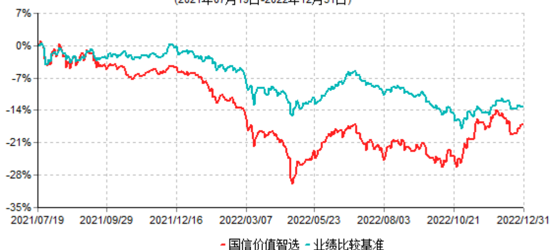
国信价值智选混合型集合资产管理计划累计净值增长率与业绩比较基准收益率历史走势对比图 (2021年07月19日-2022年12月31日)

注：（1）本集合资产管理计划合同于2021年07月19日生效，截至本报告期末本集合资产管理计划运作已满一年。（2）按集合计划合同和招募说明书的约定，本集合计划建仓期为合同生效后6个月，建仓期结束时各项资产配置比例符合合同有关规定。