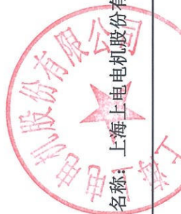
2022年度非经营性资金占用及其他关联资金往来情况汇总表