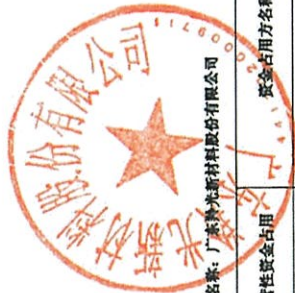
2022年度非经营性资金占用及其他关联资金往来情况汇总表