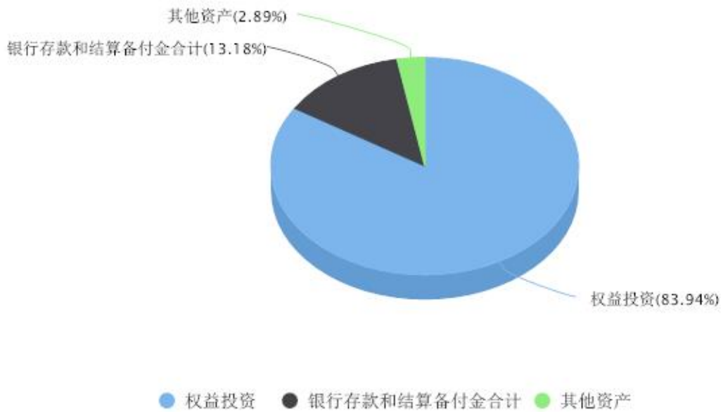
添富全球医疗混合(QDII)美元现钞区域配置图表