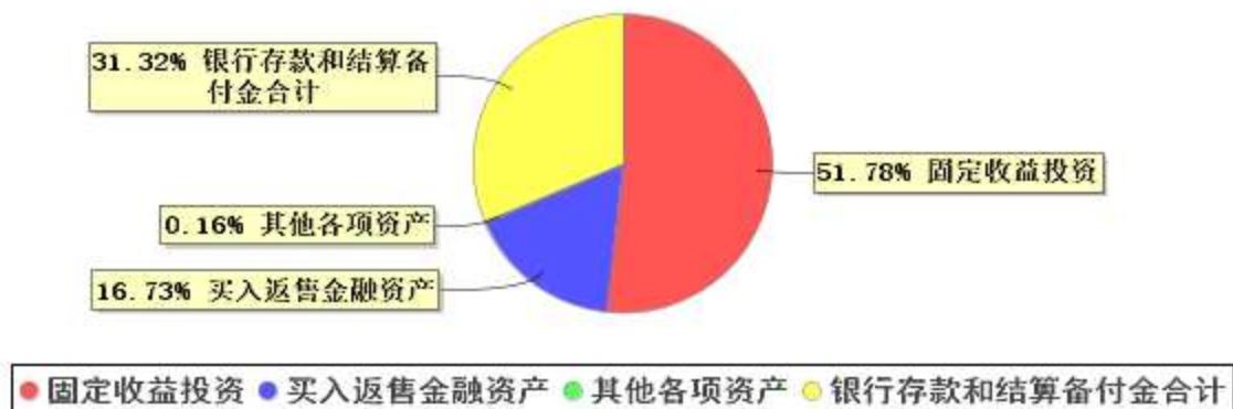
投资组合资产配置图表(2022年3月31日)