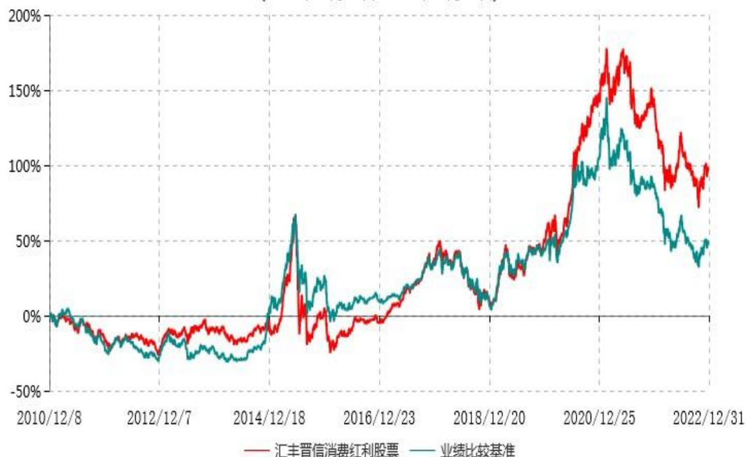
汇丰晋信消费红利股票型证券投资基金累计净值增长率与业绩比较基准收益率历史走势对比图 (2010年12月08日-2022年12月31日)

注：1.按照基金合同的约定，本基金的投资组合比例为：股票投资比例范围为基金资产的85%-95%，权证投资比例范围为基金资产净值的0%-3%。固定收益类证券、现金和其他资产投资比例范围为基金资产的5%-15%，其中现金（不包括结算备付金、存出保证金、应收申购款等）或到期日在一年以内的政府债券的投资比例不低于基金资产净值的5%。按照基金合同的约定，本基金自基金合同生效日起不超过6个月内完成建仓，截止2011年6月8日，本基金的各项投资比例已达到基金合同约定的比例。