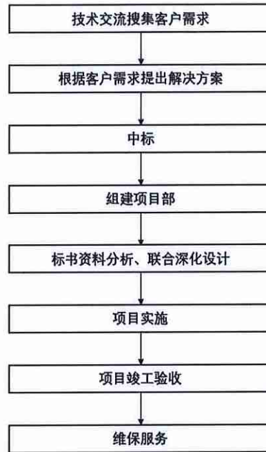
交通行业业务流程图

道交通专用、警用通信系统等解决方案。业务流程主要为：投标前公司与客户进行技术交流并根据需求提供配套的解决方案；中标后公司根据项目需求组建项目部，并开展联合深化设计，进行项目实施，最终完成项目竣工验收。此外，公司可根据客户需求为其提供项目维保服务。