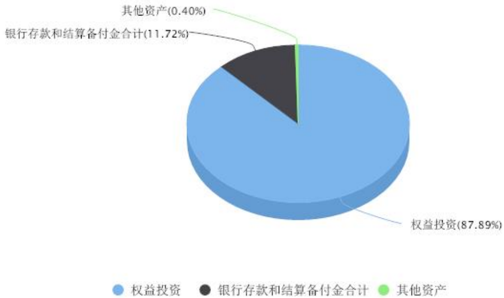
汇添富恒生指数（QDII-LOF）A区域配置图表