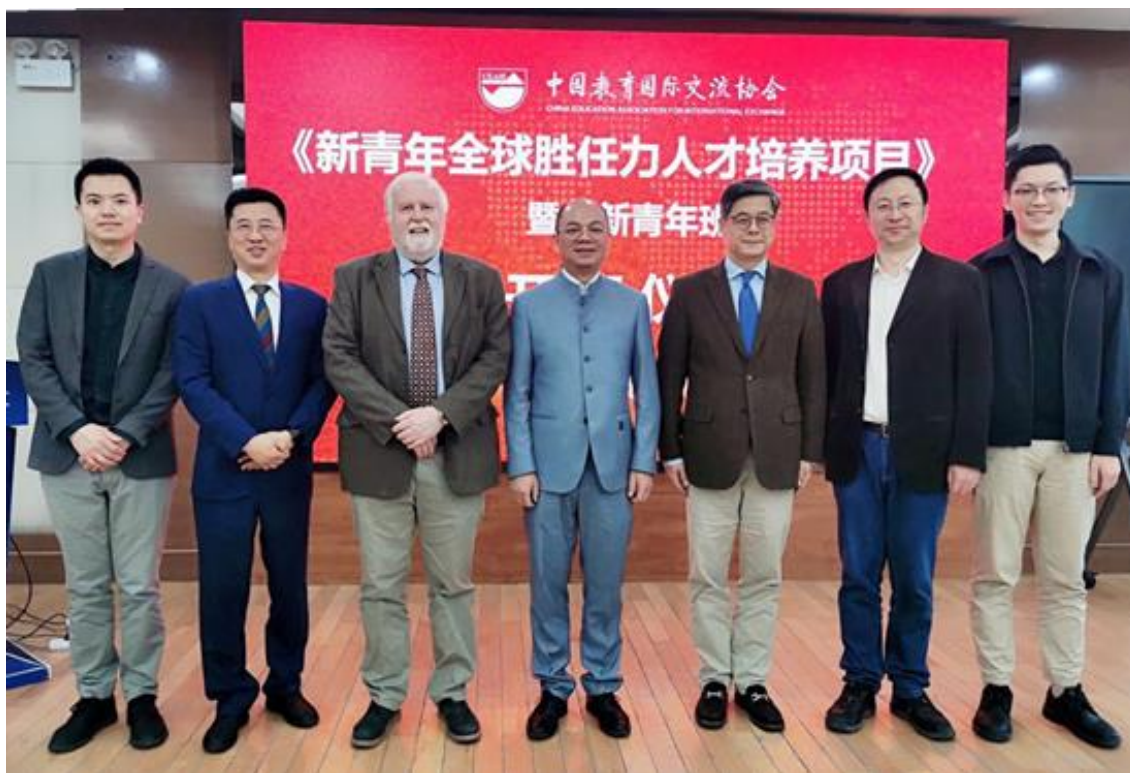
“新青年全球胜任力人才培养计划”2022 年秋季开班仪式

东西方国际教育集团受中国教育国际交流研修学院委托，负责了“新青年全球胜任力人才培养计划”的设计策划、组织实施和运行监测。该计划是中国教育国际交流协会主办，面向国内高校学生设立的新时代青年素质能力培养项目。项目以课程与实践相结合的方式，致力于具有全球视野、国际传播能力和国际竞争力的高层次国际化人才培养。项目得到了近 150 所国内大学的认可与参与，并得到联合国开发计划署，联合国教科文组织，联合国儿童基金会，世界卫生组织，世界贸易组织，联合国南南合作办公室等国际组织和国内外跨国企业的支持。