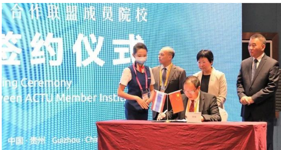
中泰高等教育合作联盟成员院校合作协议签署仪式

其间，论坛举办了“国际青年学子论坛”平行活动，来自华东师范大学、江苏大学、安徽大学、国际关系学院、四川外国语大学、西安外国语大学、贵阳学院、贵州财经大学、泰国加拉信大学等院校青年学生在论坛上用英文做了发言。论坛为中外青年互相学习、建立友谊、交流互鉴创造了一个良好机会。