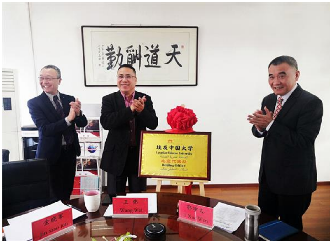
埃及中国大学北京代表处揭牌仪式现场

的领导、教师代表，埃及中国大学总部和北京代表处的领导和教师参加了在线直播揭牌仪式，共同见证了埃及中国大学北京代表处的诞生。