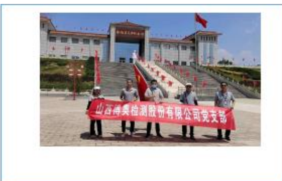
党员先锋队外出参观学习