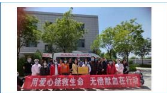
积极响应太原市血液中心号召，动员公司员工献血