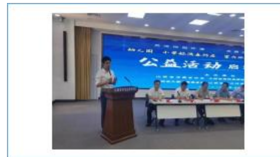
投身“幼儿园、小学校消毒防疫、室内环境检测及污染防治”公益活动