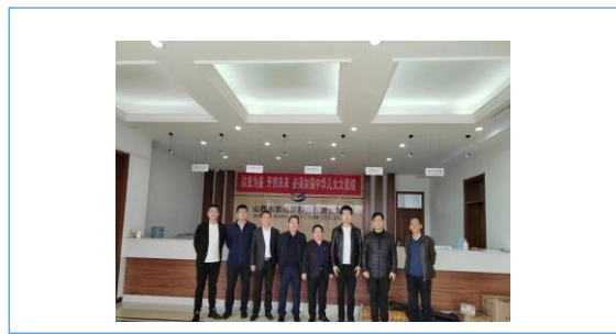
加强企业间交流，共创融合发展