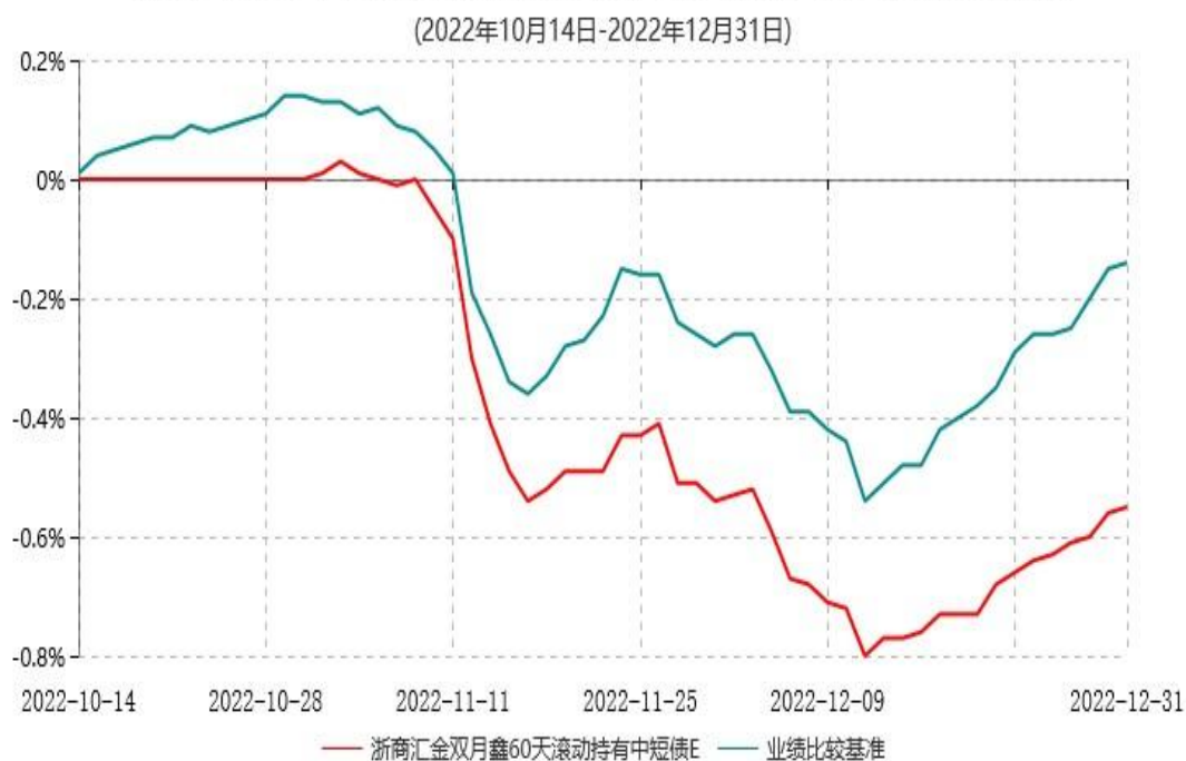
浙商汇金双月鑫60天滚动持有中短债E累计净值增长率与业绩比较基准收益率历史走势对比图

注：本基金合同生效日为 2022 年 04 月 19 日，自合同生效日起至本报告期末不足一年。至本报告期末，本基金已完成建仓，但报告期末距建仓结束不满一年，建仓期为 2022 年 04 月 19 日-2022 年 10 月 18 日，本基金建仓期结束时各项资产配置比例符合合同的约定。