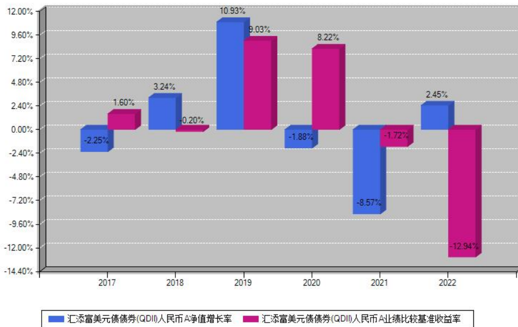
汇添富美元债债券(QDII)人民币A每年净值增长率与同期业绩基准收益率对比图

注：基金的过往业绩不代表未来表现。本《基金合同》生效之日为2017年04月20日，合同生效当年按实际存续期计算，不按整个自然年度进行折算。