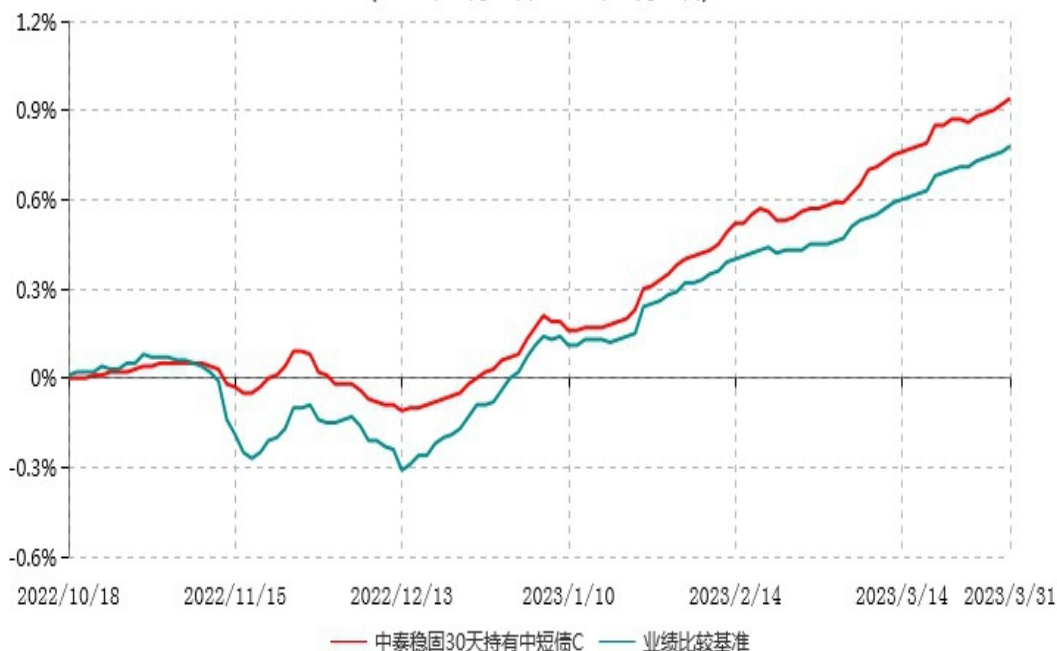
中泰稳固30天持有期中短债C累计净值增长率与业绩比较基准收益率历史走势对比图 (2022年10月18日-2023年03月31日)