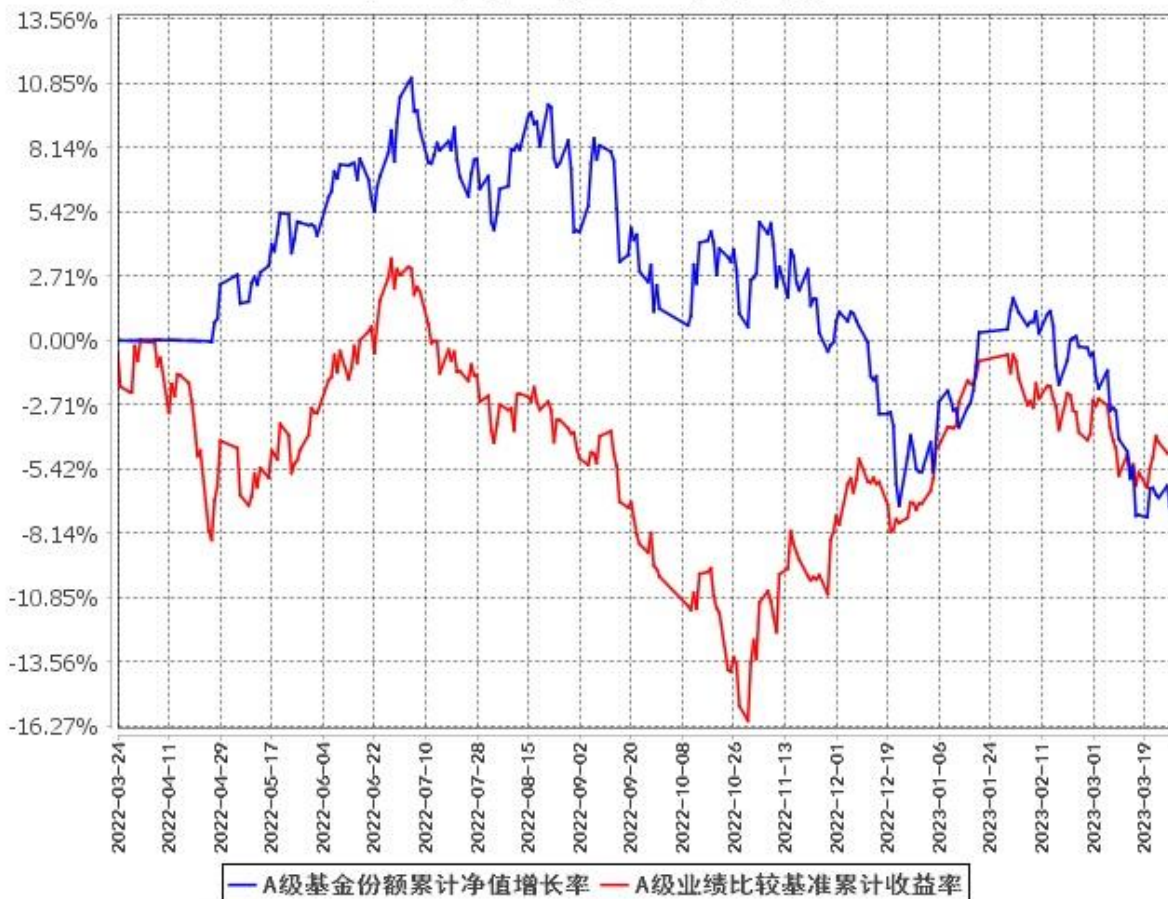
A级基金份额累计净值增长率与同期业绩比较基准收益率的历史走势对比图 (2022年3月24日至2023年3月31日)