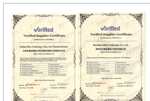
公司于 2022 年通过阿里巴巴国际站金品诚企认证