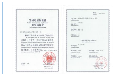
公司产品 8 端口 RFID 超高频模块 SIM7300 通过中国无委会 SRRC 认证