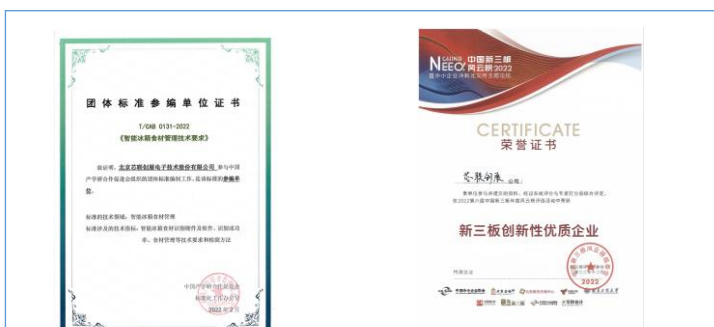
公司作为参编单位参加团体标准《智能冰箱食材管理技术要求》T/CAB 0131-2022 标准编写