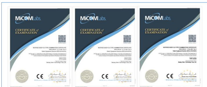
公司产品 RFID 超高频模块 SIM7300、SIM7400、SIM3600 通过 CE 认证