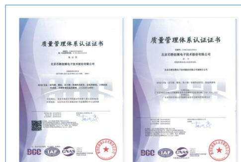
公司于 2022 年再次通过 ISO9001:2015 质量管理体系认证