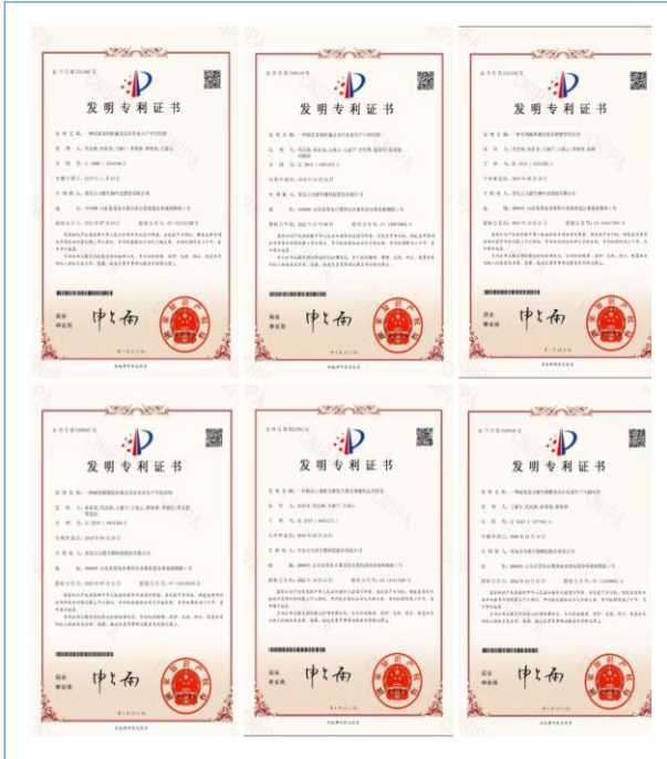
公司新授权发明新型专利 6 件。