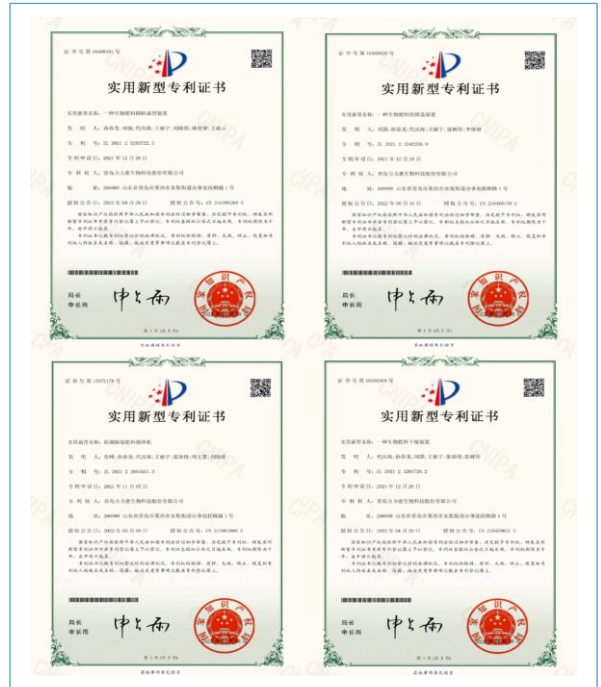
公司新授权实用新型专利 4 件。