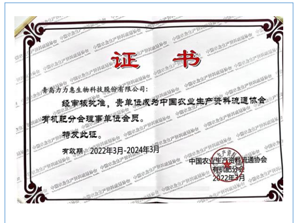
公司成为“中国农业生产资料流通协会 有机肥分会理事单位”。