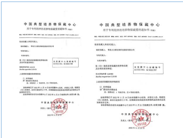
公司新筛选、保藏专利菌种 2 个。