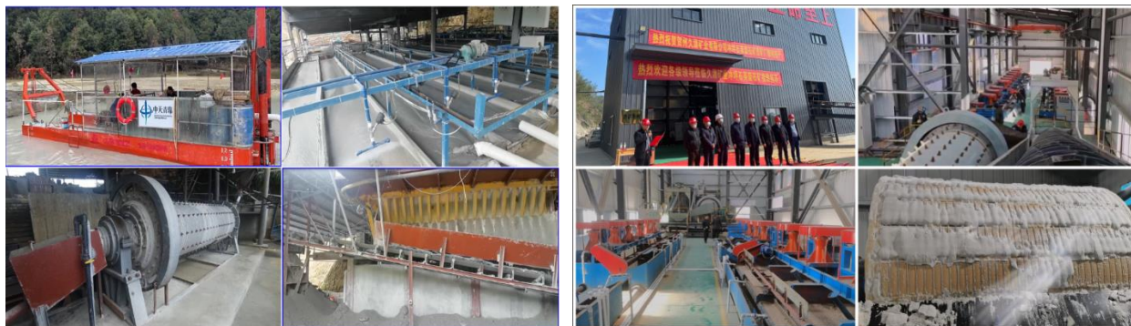
平江县长子坡尾矿库清空闭库工程项目