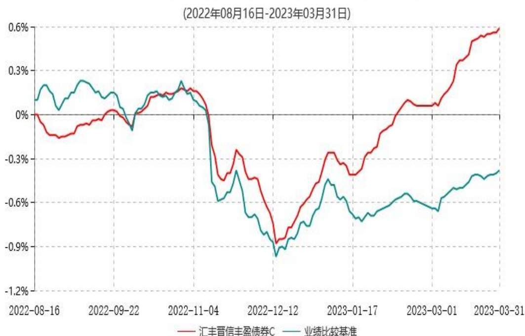
汇丰晋信丰盈债券C累计净值增长率与业绩比较基准收益率历史走势对比图