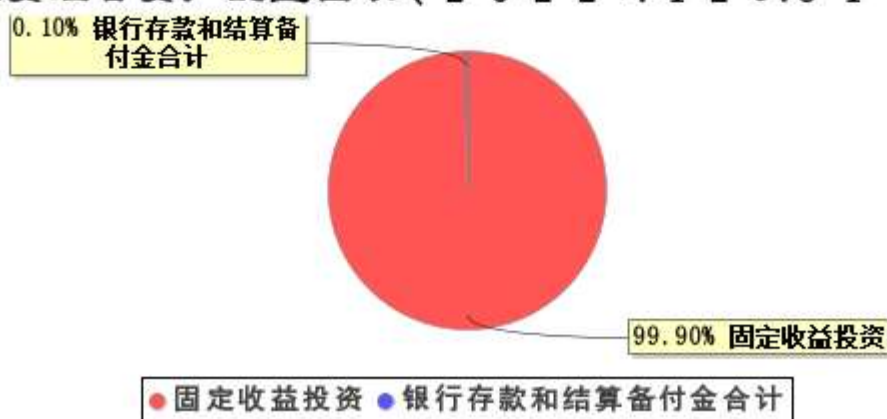
投资组合资产配置图表（2022年12月31日）