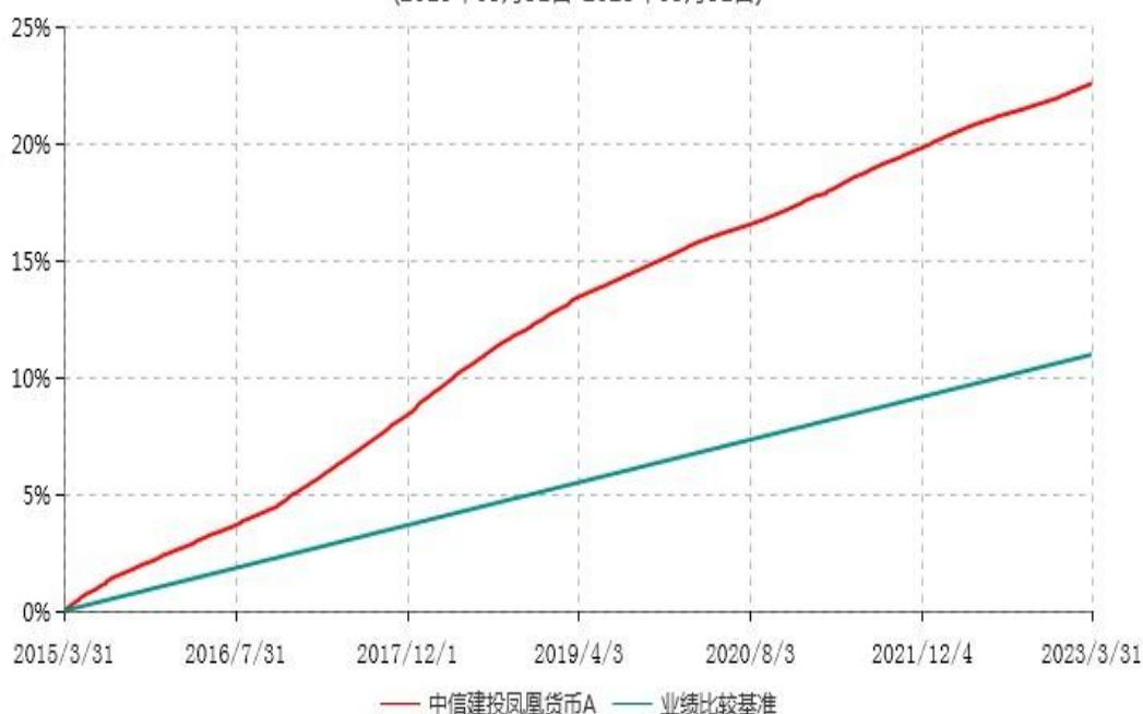
中信建投凤凰货币A累计净值收益率与业绩比较基准收益率历史走势对比图 (2015年03月31日-2023年03月31日)