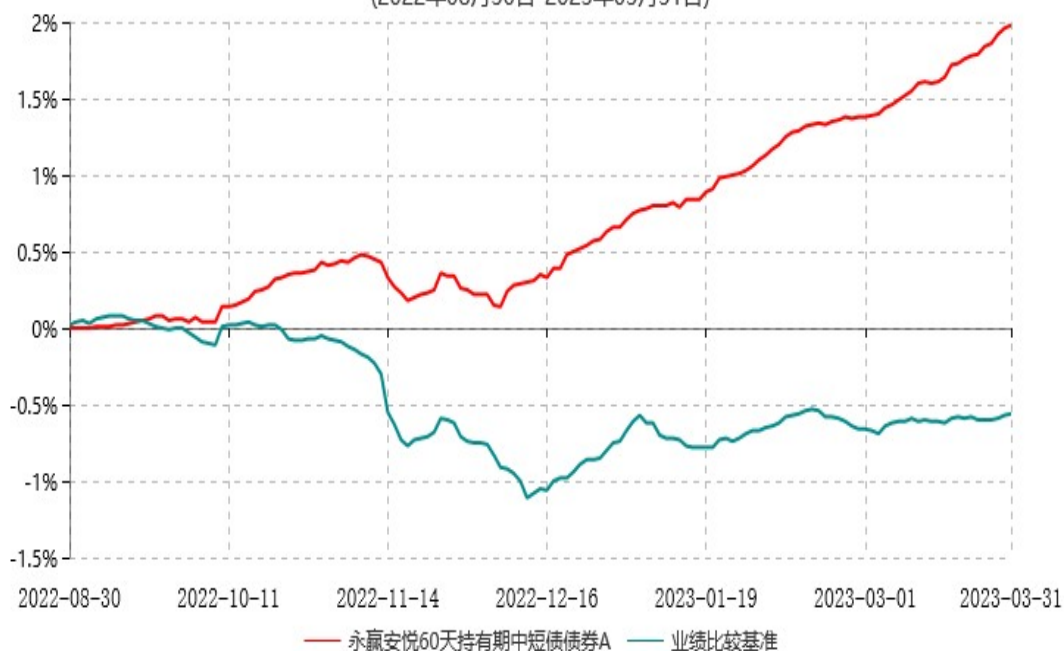
永赢安悦60天持有期中短债债券A累计净值增长率与业绩比较基准收益率历史走势对比图 (2022年08月30日-2023年03月31日)