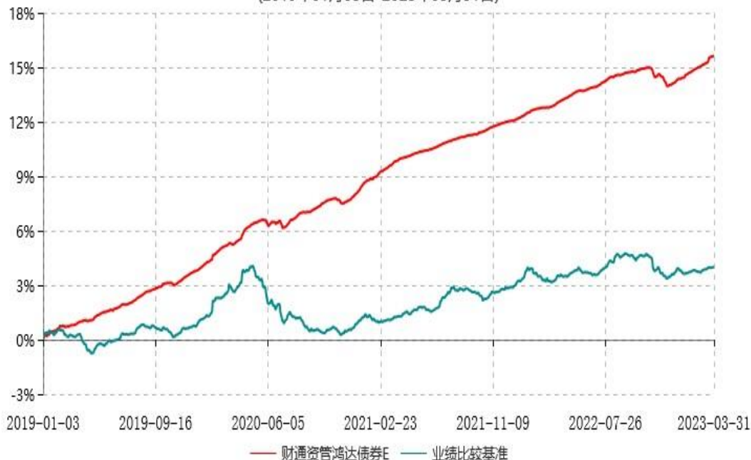
财通资管鸿达债券I累计净值增长率与业绩比较基准收益率历史走势对比图