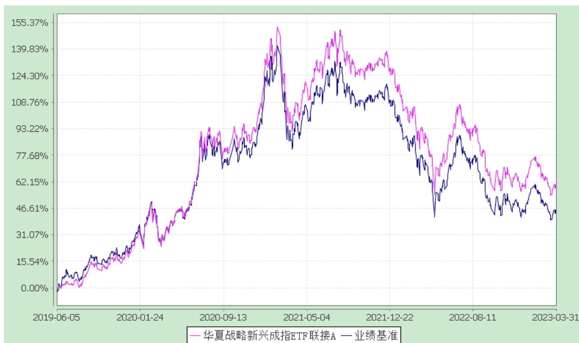
华夏战略新兴成指 ETF 联接 C: