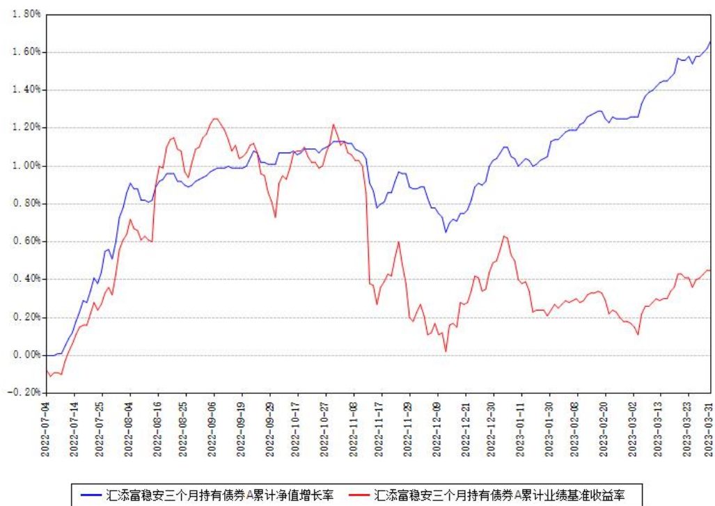
汇添富稳安三个月持有债券A累计净值增长率与同期业绩比较基准收益率对比图