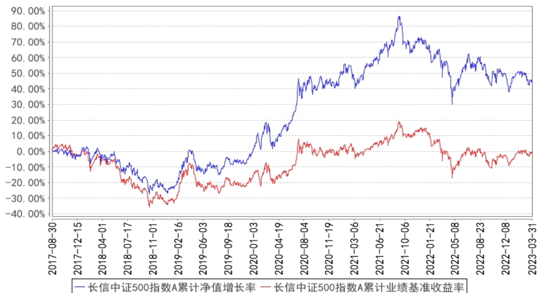
长信中证500指数A累计净值增长率与同期业绩比较基准收益率的历史走势对比图